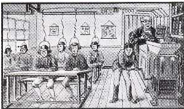
‘Koppen vullen’ in de conventionele school van het jaar 2000

Hij beval dan ook warm aan het leren in vivo van het pedagogische zelfbestuur, niet alleen om academische of professionele kennis op te doen, maar ook met het oog op sociale doeleinden. De 'school van het volk' moet aan het volk de mogelijkheid bieden zijn eigen waardesysteem te ontwikkelen en te experimenteren met de libertaire praktijken door opvoeding en in opvoedingssituaties. Op school wordt de klas het sociale laboratorium waar men bouwt, debatteert, beslist, zich perfectioneert... De libertaire pedagogie van het zelfbestuur is dus initiatiefnemer en 'prefiguratrice' van verschillende sociale functies, niet meer die van wedijver, van competitie maar collectief bestuur van het algemeen belang.