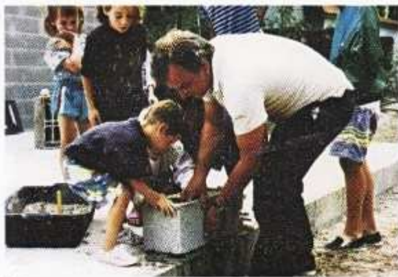
École Bonaventure, pose de la première pierre (Fonds Bonaventure)

In een recentere periode zijn er hernieuwde experimenten op gezet, zoals met de school in Da Ponte (Portugal), na de Anjerrevolutie in 1974, waar honderden kinderen naar toe gingen. Eveneens kan gewezen worden op de libertaire school Bonaventure (1993-2001) op het Franse eiland Oléron. Daar vond een schoolexperiment plaats geleid door de gedachte van vrijheid, gelijkheid, wederkerige hulp, zelfbestuur en burgerzin. Hoog hing er de vlag van de laïciteit, kosteloosheid, sociale financiering, collectieve eigendom, gelijkheid in salaris. Zo zijn er ook nog de experimentele lycea in Frankrijk waarvan de LAP (het zelfbestuurde lyceum van Parijs) in dit jaar zijn dertigjarige bestaan viert. Reeds duizenden leerlingen hebben hier onderwijs genoten, onderwijl andere ervaringen opdoende zoals het sociale zelfbestuur.