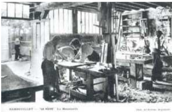
De timmerwerkplaats van La Ruche